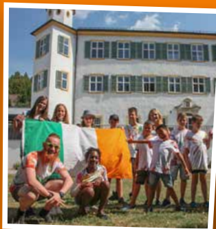
JUGENDHAUS SCHLOSS PFÜNZ